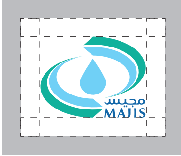
أيقونة الشعار Logo Icon